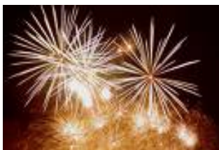
Alles wird anders im Neuen Jahr?